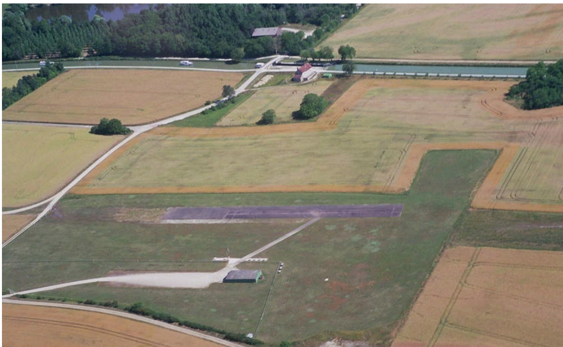
vue du terrain

Arrivé à VINCELLES, il y a une espèce de carrefour avec sur la droite un garage Prendre à gauche pour entrer dans le bled, traverser la voie ferrée et un peu plus loin tourner à droite (je crois que c'est la première.) Traverser tout VINCELLES sur cette rue principale, sortir un peu de VINCELLES, IL y a plus que quelques maisons. En fait longer la nationale de l'autre côté des maisons et retrouver la voie ferrée en sortie du patelin Juste avant le passage à niveau, prendre le chemin sur la gauche il me semble qu'il y a une pancarte qui l'indique, après c'est tout droit